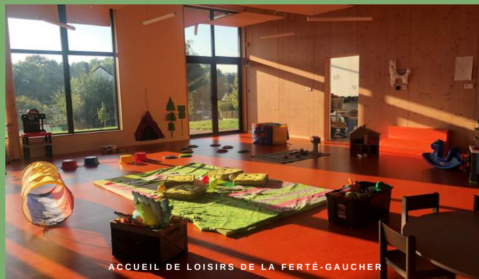
ACCUEIL DE LOISIRS DE LA FERTÉ-GAUCHER