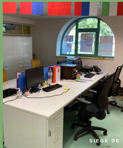
SIÈGE DE LA FÉDÉRATION