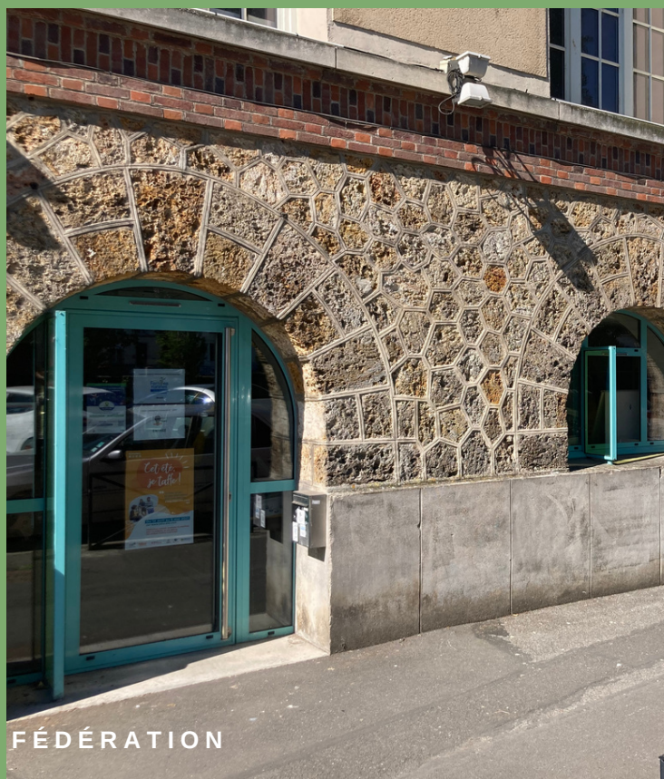
SIEGE DE LA FÉDÉRATION