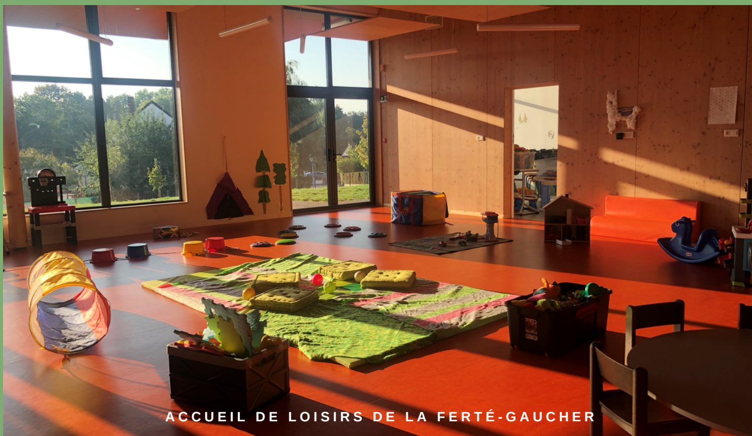
ACCUEIL DE LOISIRS DE LA FERTÉ-GAUCHER